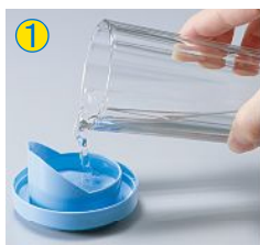
① フタに水を入れる