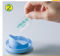
② 食塩を入れかき混ぜる