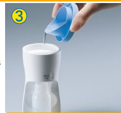
③ スプレーボトルをセットして食塩水を本体(電解槽)に注ぐ